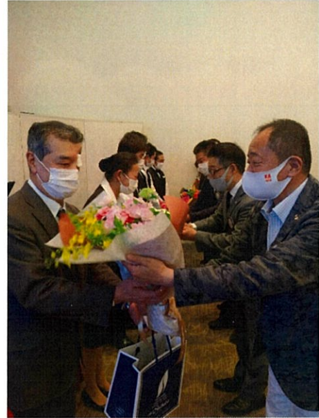
大塔総支配人よりご挨拶

5月1日より無期限休業となる衣浦グランドホテルでの最後の例会となりました。お世話になった皆さんに花束とお菓子のお礼を差し上げました。