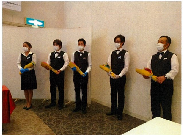
23年間お世話になりました。