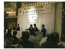
財団関係者のフリーディスカッション